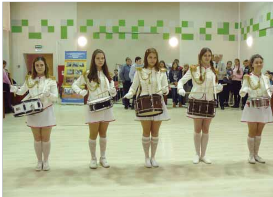
Выступление группы барабанщиц «Версавия».