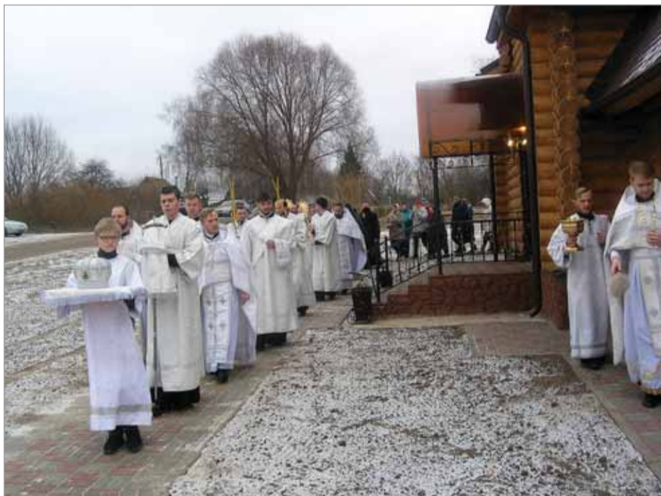
Крестный ход священнослужителей и прихожан вокруг храма Архистратига Божия Михаила.