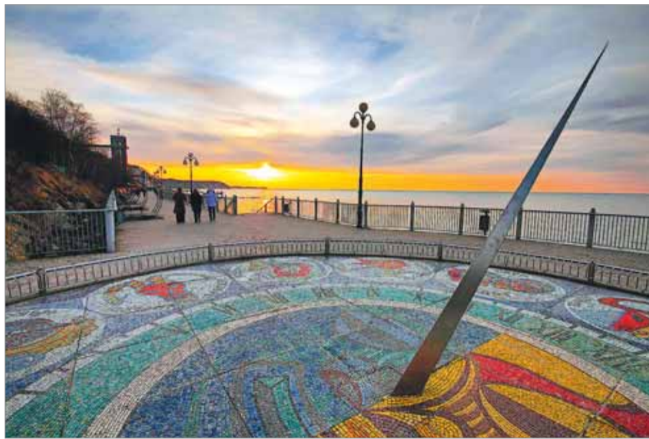
Солнечные часы на закате в Светлогорске.

В области немало памятников истории прусского и орденского периода (имеется в виду Тевтонский орден). В основном это руины замков и кирх, остатки валов и городищ. Католичество здесь было вытеснено протестантизмом. Теперь же преобладает православие, и наши православные храмы размещены в бывших кирхах. Мне довелось побывать в таких и в Балтийске (бывшем Пиллау), и в Светлогорске (бывшем Раушене). Символ Калининграда - огромный готический собор, близ которого могила Канта. Несколько веков это был католический храм, потом стал главным лютеранским собором, а теперь - там музеи и орган зал. Сейчас уже оборудованы евангелическая и православная часовни. Недалеко от собора возвышается недавно построенная огромная синагога.