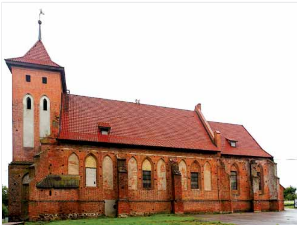
Храм Святой Великомученицы Екатерины в Родниках Гурьевском районе Калининградской области.

Мне собор показался тяжелым и мрачным. Не только молиться, но даже орган слушать внутри него мне бы не хотелось. Совсем в другом месте удалось обрести светлые благодатные переживания. Другу привезли меня в монастырь Святой Екатерины близ Калининграда бывшее предместье Арнау, сейчас поселок Родники. Здесь храм, посвященный великомученице, стоит с XIV века. Так что вот уже восьмое столетие святая Екатерина незримо в нем пребывает. И это дивным образом удалось ощутить: внутри храма вдруг перед внутренним взором стали проходить все знакомые мне Екатерины. И так отчетливо и ясно, что молитва о них сама собой зазвучала в душе. Было изумительное чувство: святая так хорошо знает всех-всех Екатерину мира, что в этом ей посвященном храме невольно происходит таинственный резонанс между этим ее знанием и моим «списком» знакомых с таким именем. Даже жаль было, что у меня не так уж много знакомых Екатерину.