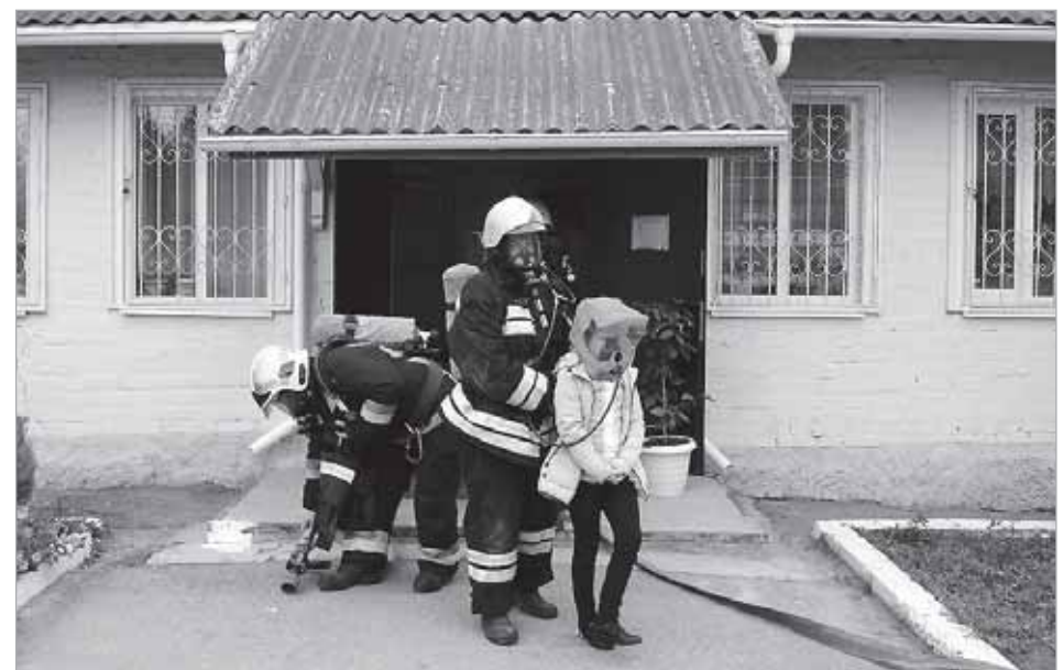
Эвакуация школьницы из «задымленного» помещения спасателями МЧС.