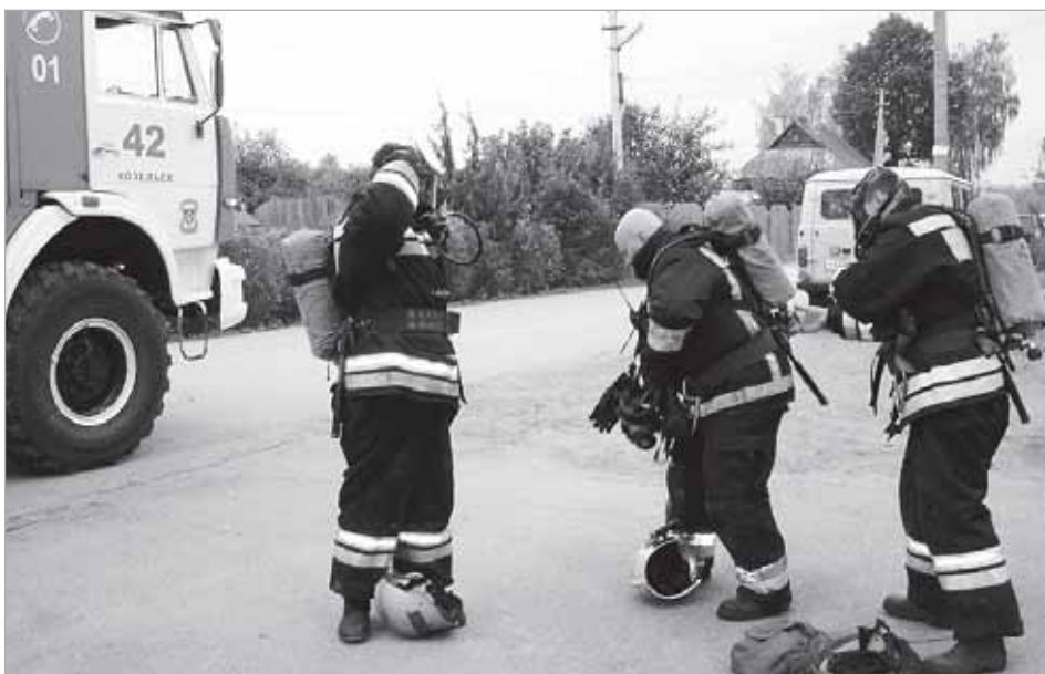
Один из рабочих моментов учений.