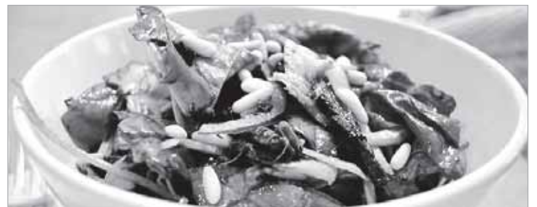
Такой салат можно подать как легкую закуску или в качестве гарнира.

4. В сервировочную тарелку положите пучок шпината. На него выложите обжаренные шампиньоны. Распределите нарезанный синий лук. Посыпьте кедровыми орешками. Сбрызните салат оливковым маслом. Посыпьте солью и свежемолотым черным перцем по вкусу. Постный салат с грибами готов! Приятного аппетита!