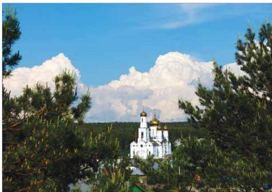
Серафима КУВАЕВА. «Величие».