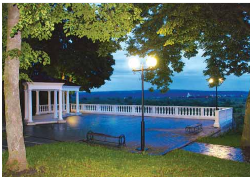
Злата ИГРАЕВА. «Мой город».