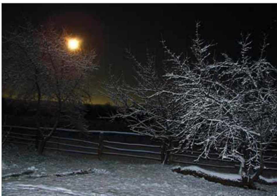
Софья ИСАЕВА. «Первый снег».