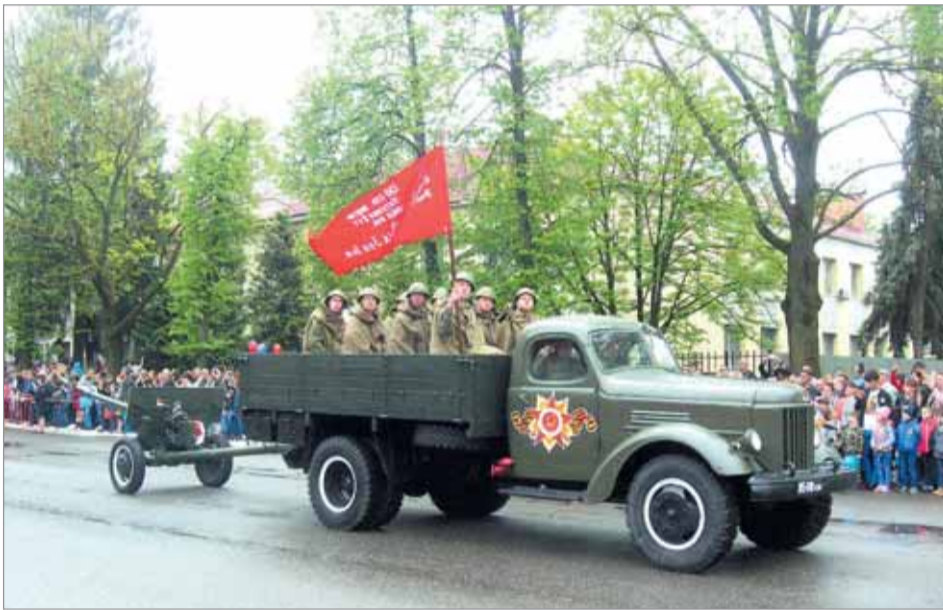
На военном параде военнослужащие 28-й гвардейской ракетной Краснознаменной дивизии.