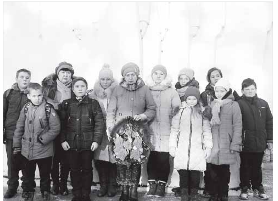
Завершился урок мужества возложением цветов к памятнику погибшим воинам сельского поселения «Деревня Дешовки».

Н. БАУЭР, методист МКУК «Дешовское КДО».