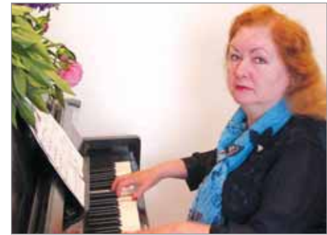
↑ Композитор Валентина ДРАЦЕВИЧ .